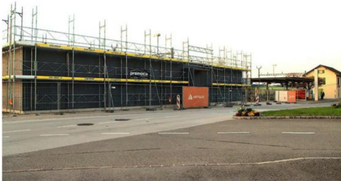
Le bâtiment de service des CFF (premier plan) est sorti de terre, les voies et les quais suivront.

Si le bâtiment de service des CFF est déjà sorti de terre, la suite des travaux consistera à construire un deuxième quai et un passage sous voie avec ses accès, escaliers et rampes avec une déclivité normalisée, soit une pente de 10%. Le quai existant sera adapté à la LHand et ceux en direction de la Landi jusque-là consacrés aux marchandises, démolis. Les lignes électriques et leurs mâts ainsi que les installations de sécurité seront renouvelés. «Ce projet rendra le trafic plus robuste, car tout sera dirigé par