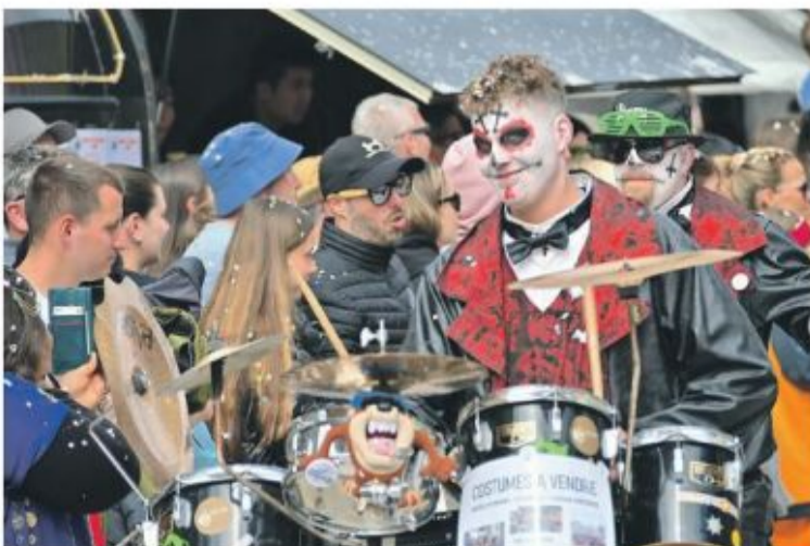
La Crystal guggen en voisine.