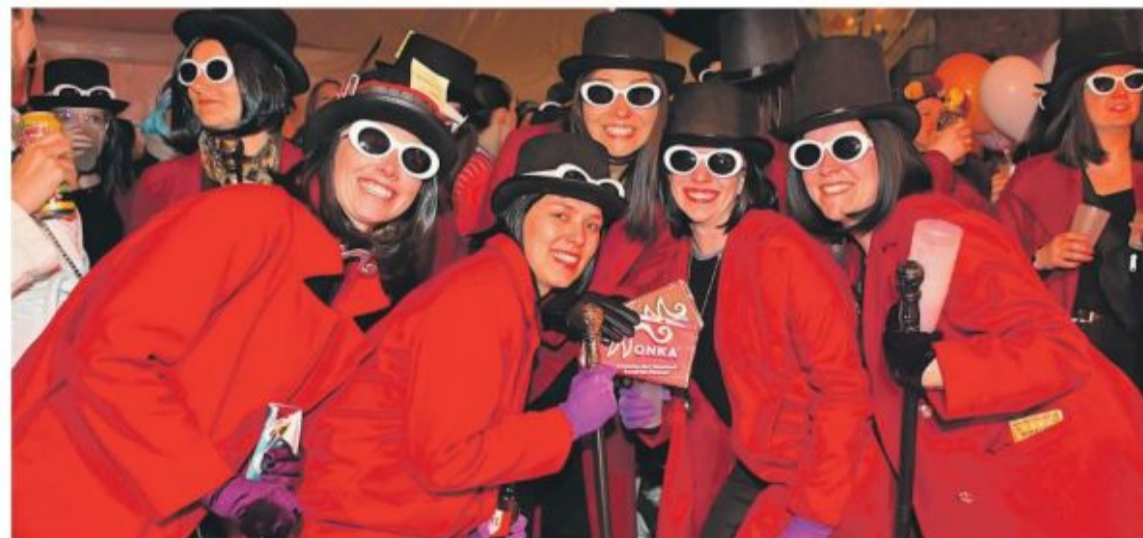
En mode festif vendredi soir.