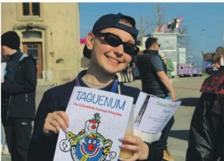
Le journal satirique Taguenum a été distribué dimanche.