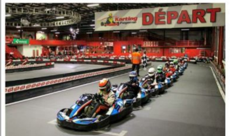
Les pilotes ont fait le spectacle vendredi au Karting de Payerne.

BELLE SOIRÉE La première manche des courses SWS Sprint avec les catégories sport et électriques de la dernière génération s'est déroulée vendredi passé au Karting de Payerne.