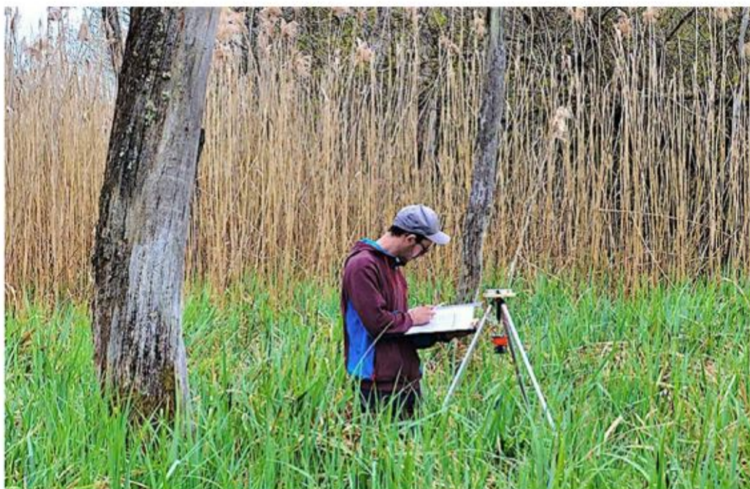
Fruit de cette collaboration avec l'Université de Lausanne, une quinzaine de projets de recherche seront proposés à des étudiants dont le cursus intègre la Faculté des géosciences et de l'environnement.

Ces discussions ont débouché, entre autres, sur l'esquisse d'une quinzaine de projets susceptibles de faire l'objet de travaux de bachelor, de master ou même de thèses. «Les énoncés sont plutôt variés. Cela concerne autant