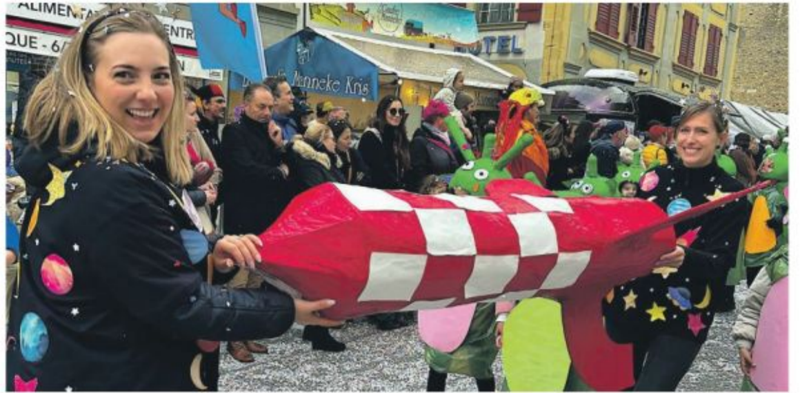
Les organisateurs ont été bluffés par le travail des écoles.