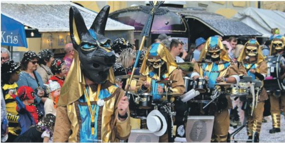
Costumés et heureux.