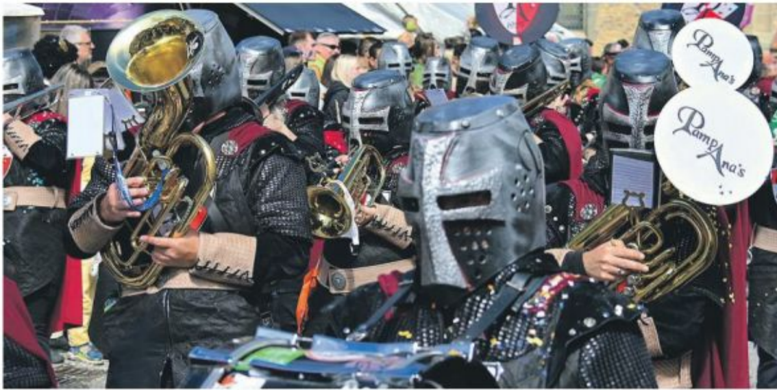
Les Pampana's en croisade.