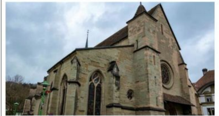
L'avenir de la paroisse réformée de Moudon-Syens reste encore à définir.