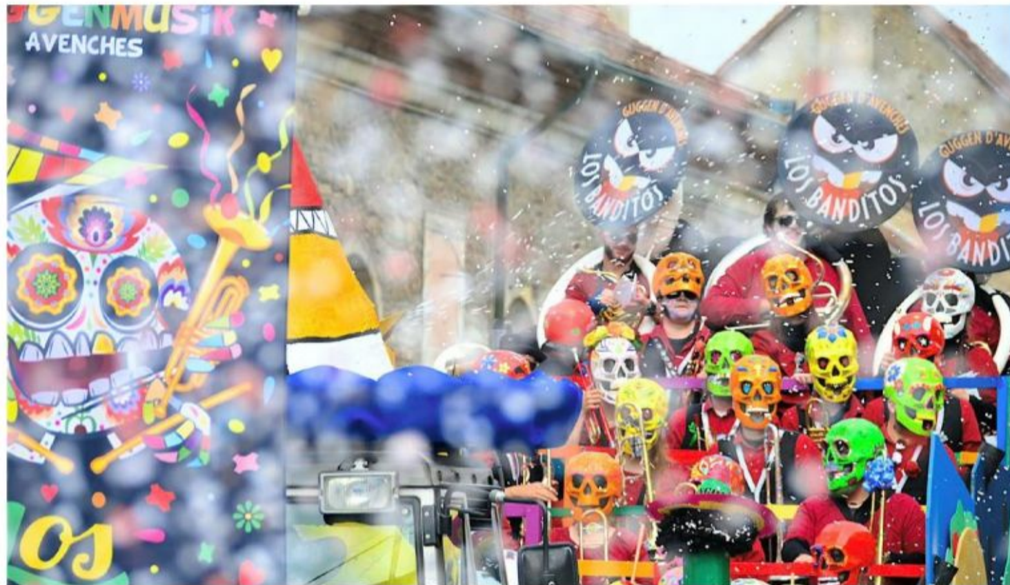
Dimanche, lors du grand cortège humoristique, la guggen avenchoise Los Banditos a choisi de parader sur un char.