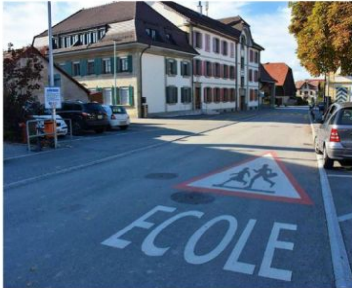
Pour réaliser de nouvelles écoles, l'ASIPE propose d'augmenter le plafond d'endettement.

Ce projet va dans le sens de la recommandation de la Direction générale de l'enseignement obliga-