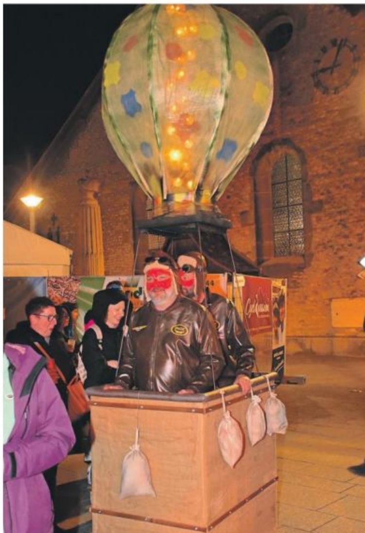
Idéal pour un tour du monde, le ballon!