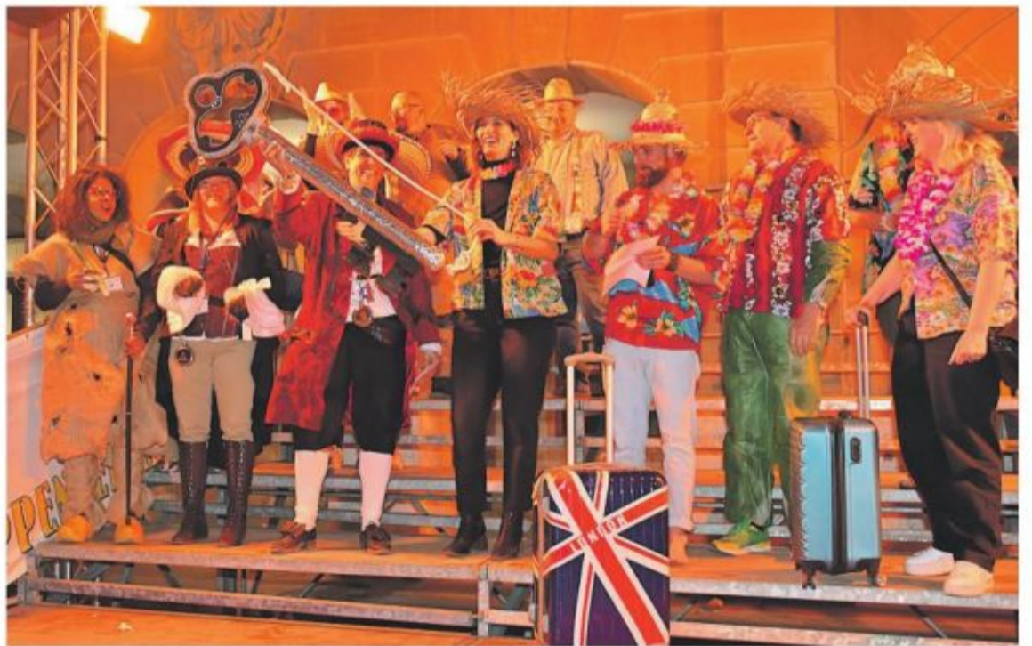
La Municipalité a remis les clés de la ville au comité d'organisation vendredi soir.