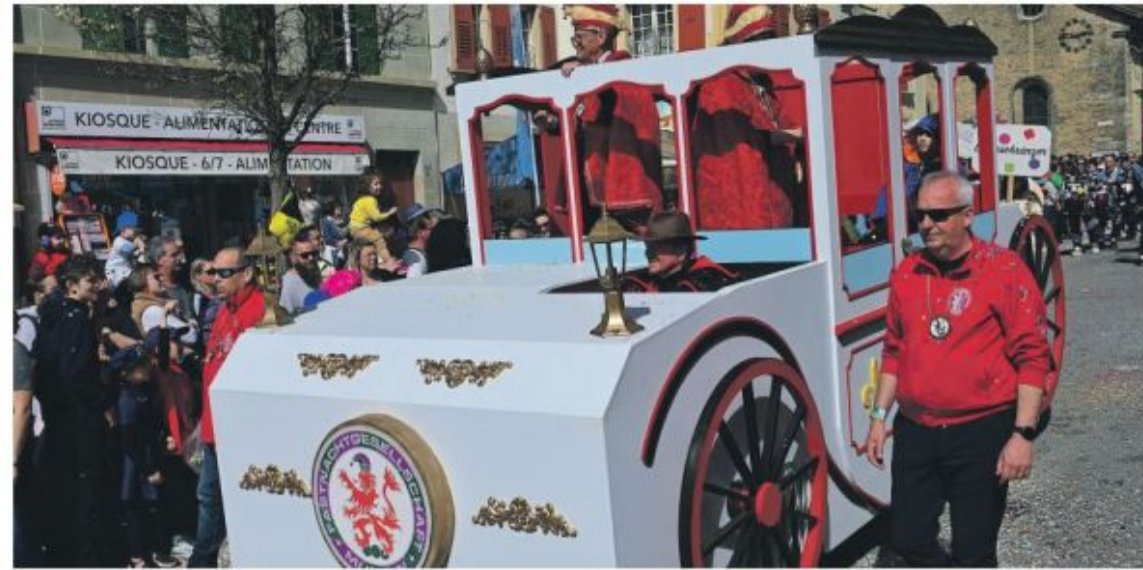
Le carrosse royal de Morat était du défilé dimanche.