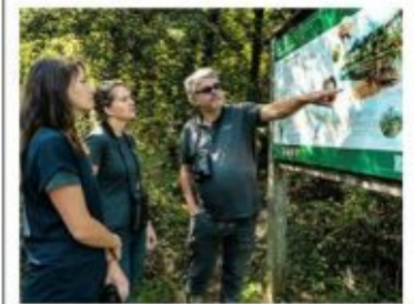
Les sorties sont prévues en compagnie de biologistes.

Le retour des beaux jours a de quoi ravir les badauds et autres amoureux de la nature. Cette année encore, il sera possible d'explorer la réserve naturelle de la Grande Caricaie sous des angles différents: à pied, à vélo ou même en canoë.