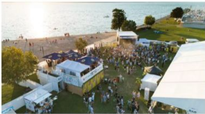
La plage de Portalban s'apprête à vibrer, du 14 au 17 août.

MUSIQUE Le festival broyard lève le voile sur sa nouvelle édition. Une soirée est même dédiée aux nouveaux venus de la scène helvétique.