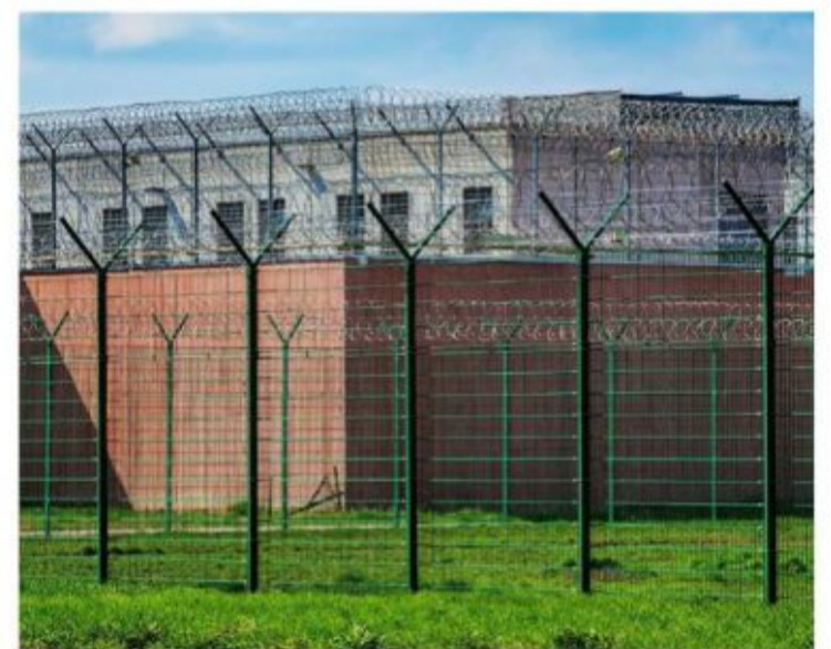
Le projet comprend la construction de la nouvelle prison centrale pour le régime de détention provisoire ainsi que d'un bâtiment dédié à l'exécution des peines en semi-détention et le travail externe. Sont encore inclus les agrandissements de la cuisine et du parking.

Le projet comprend la construction de la nouvelle prison centrale pour le régime de détention provisoire et d'un bâtiment dédié à l'exécution des peines en semi-détention et le travail externe. Sont également inclus les agran-