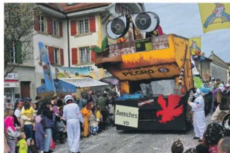
Des chars impressionnants.