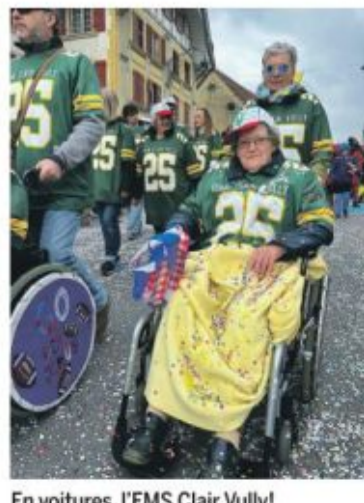
En voitures, l'EMS Clair Vully!