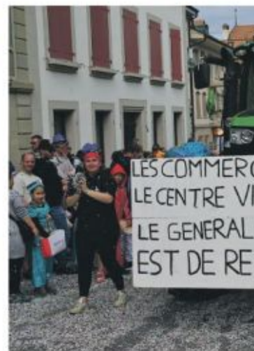
Des slogans et des confettis.