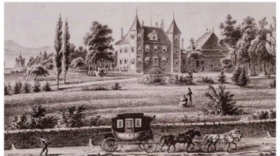
Diligence sur la route de Berne.

DESSIN DE RIC BERGER. EXTRAIT DE LA BROCHURE HENNIEZ AUX SOURCES DE L'HISTOIRE, ÉDITÉE PAR HENNIEZ-SANTÉ S.A. ÉDITÉE PAR LE MUSÉE DU VIEUX-MOUDON (2023).