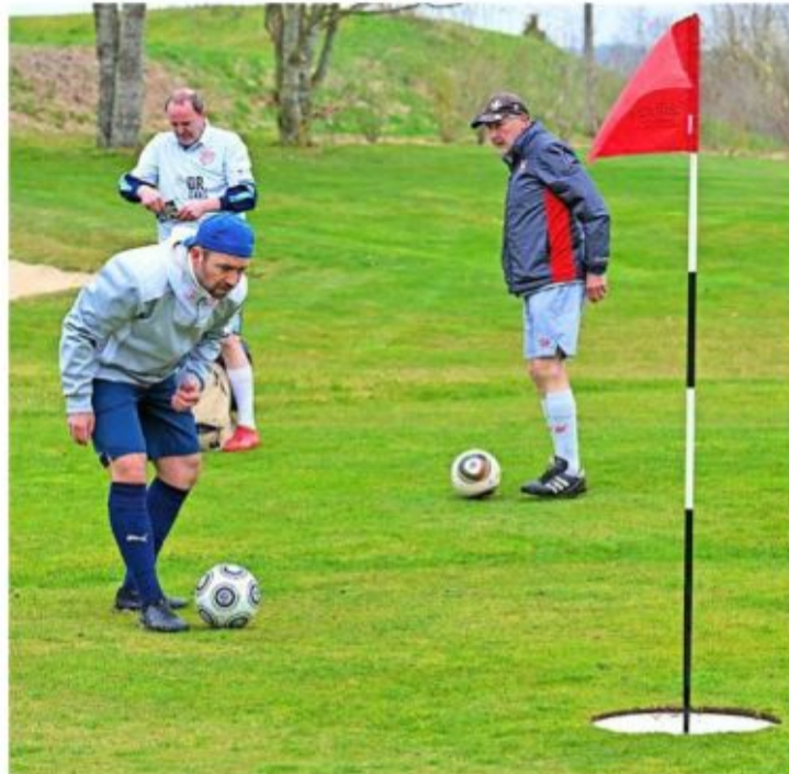
Le putting, l'art de faire rouler la balle dans le trou, demande une bonne dose de concentration chez les joueurs.

A midi, les échos étaient positifs chez les participants. «J'ai découvert le parcours hier lors de la reconnaissance. Il s'apparente à ceux que j'ai pu tester à l'Euro en Tur-