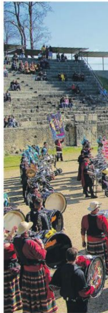
Le morceau d'ensemble dans les arènes