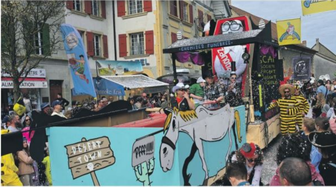
Du monde dans les rues pour le cortège dimanche.