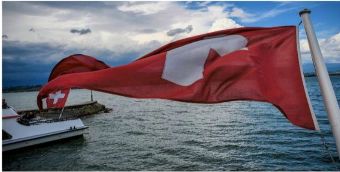
Le vent souffle fort sur la compagnie de navigation des lacs de Neuchâtel et Morat.

- Une mauvaise saison 2024, un besoin de rattrapage quant à