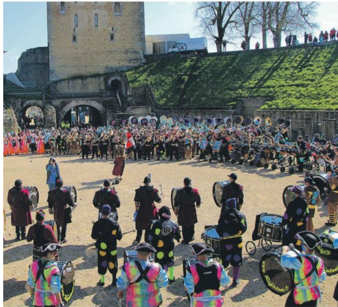
dimanche matin, avant une ovation debout pour le comité d'organisation du carnaval avenchois.