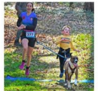
Le virus du canicross est rapidement transmis aux enfants.