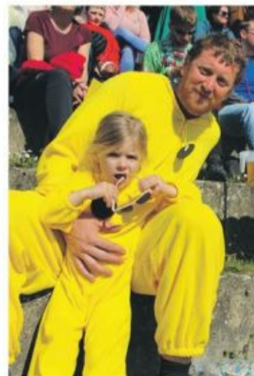
Sous le soleil et en famille.