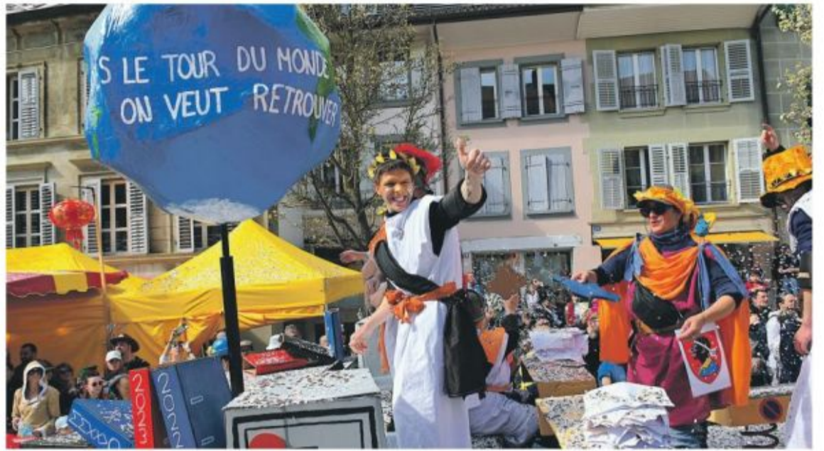
Un tour du monde et rentrer pour retrouver ses arènes.

arnaval avenchois a clôturé en beauté la saison des confettis dans la au cortège humoristique du dimanche.