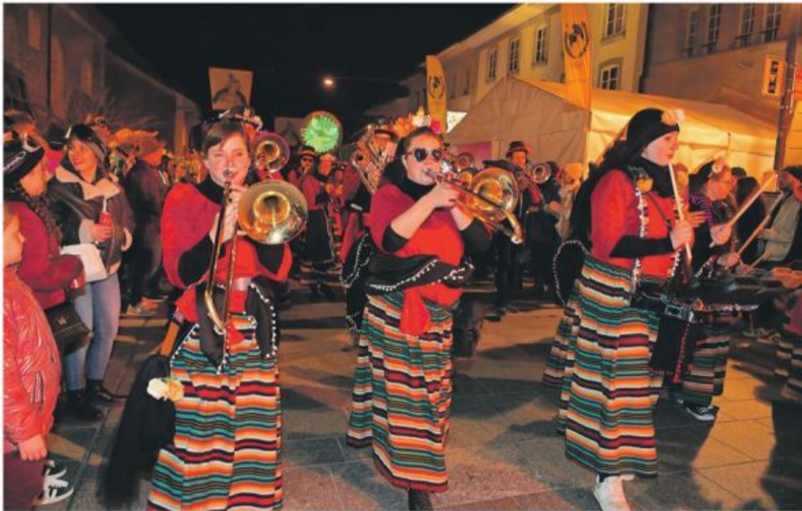
Los Banditos en tenue de soirée sud-américaine vendredi.