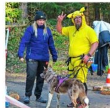
Pas le plus discret des camouflages pour courir en forêt avec son chien.

La visite de néophytes est encourageante pour le développement du canicross. «Des clubs commencent à se créer, comme dans le Gros-de-Vaud, la région de Morges ou la Broye, donnant aux gens des possibilités de découvrir la discipline et de s'entraîner. Depuis que je suis trésorier à la fédération, on est passés d'une cinquantaine de membres à plus de 100, et ça augmente. Il y a plus de visibilité, l'intérêt des sponsors est grandissant, offrant des perspectives intéressantes aux athlètes qui veulent s'investir à fond dans ce sport», se réjouit Manu Canosa. ■ ALAIN SCHAFER