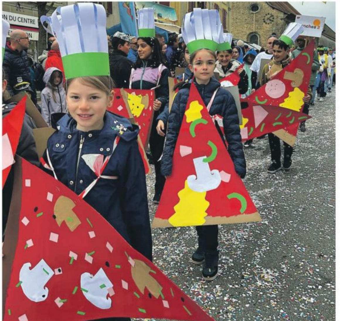
Originalité, couleurs et créativité pour le défilé des écoles samedi.