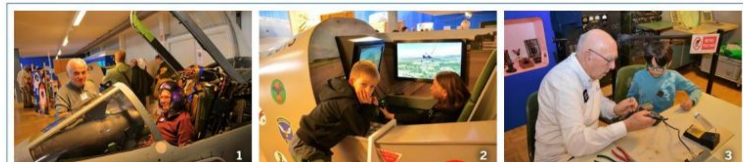
1. Le simulateur FA/18, une expérience puissante. 2. Les jeunes visiteurs étaient passionnés par les simulateurs de vol. 3. Les enfants ont pu souder et emporter un petit avion.